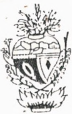
TABELA VII (Continuação)